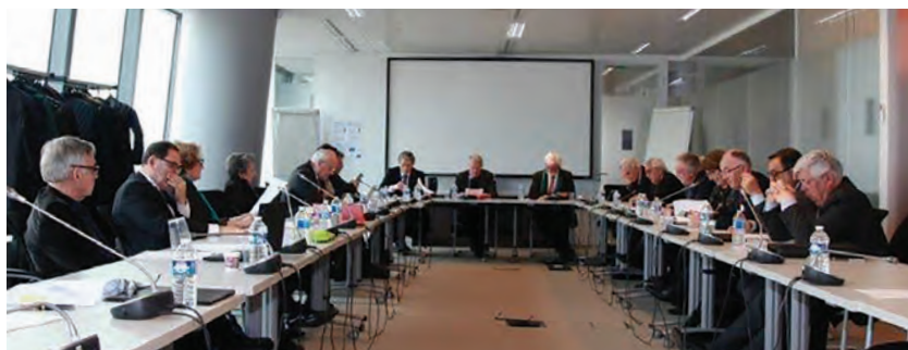
Réunion du Club des Médiateurs de Services au Public

Dans 22 cas où une réponse négative a été apportée au consommateur, j'ai été amené à confirmer ma position dans 18 cas après un nouvel examen du dossier, et dans 3 cas, je l'ai modifiée à la suite d'éléments nouveaux. Un dossier est toujours en cours d'examen.